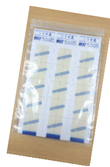
商品パッケージ(袋入り)