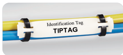
配線の表示・識別に