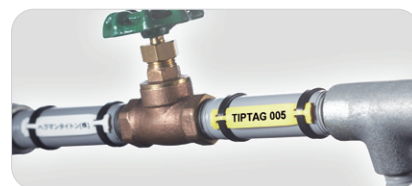
配管の表示・識別に